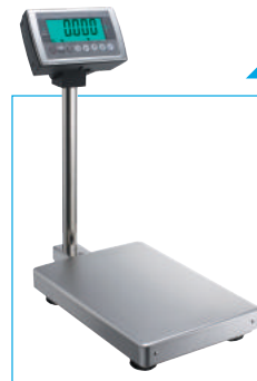
DS-55S-QAS SHORT ショートポールタイプ