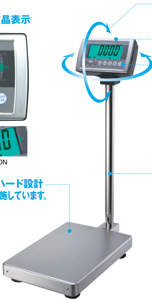
DS-55S-QAS ロングポールタイプ